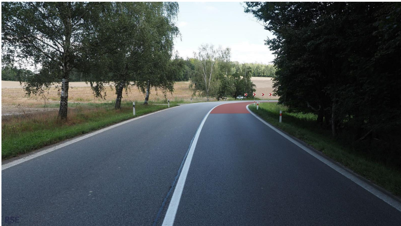
Úsek silnice I/34 u Humpolce – navržené opatření na Dopravní konferenci