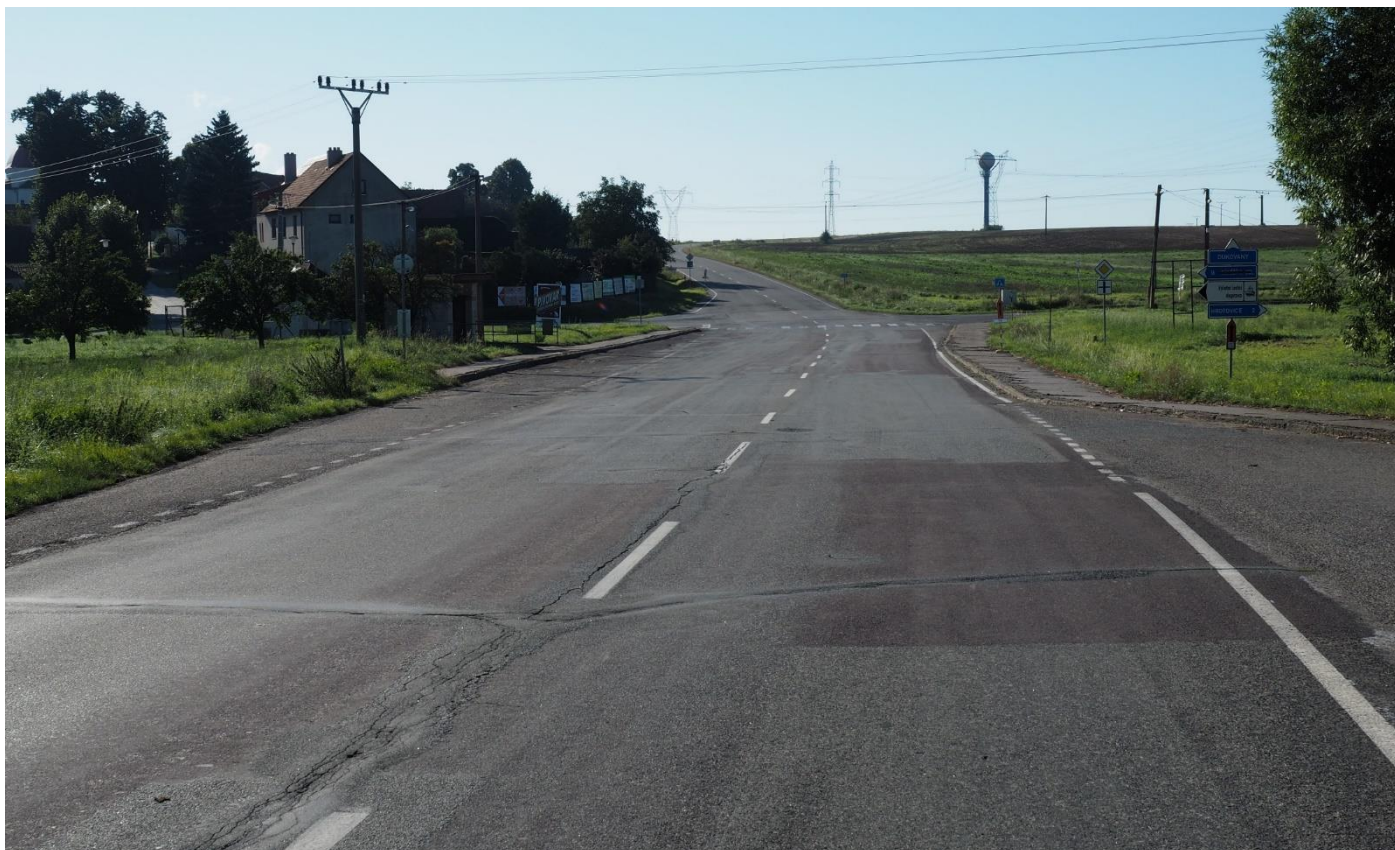
Křižovatka silnic II/351 a II/399 v Dalešicích