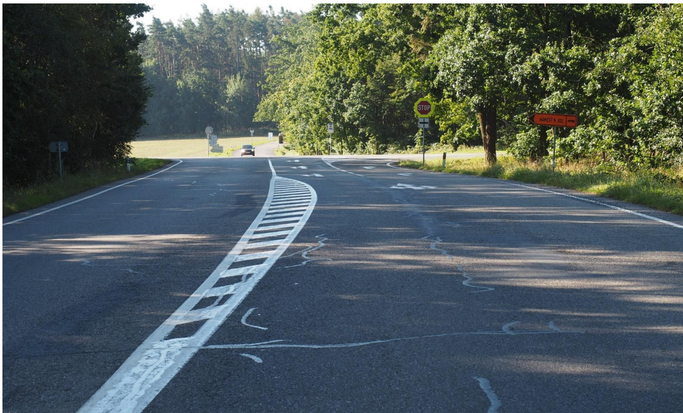
Křižovatka silnic II/152 a II/399 u Hrotovic