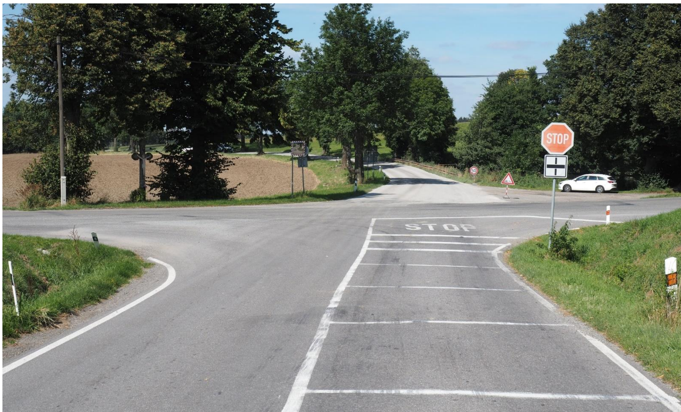
Křižovatka II/353 a II/348 u obce Stáj