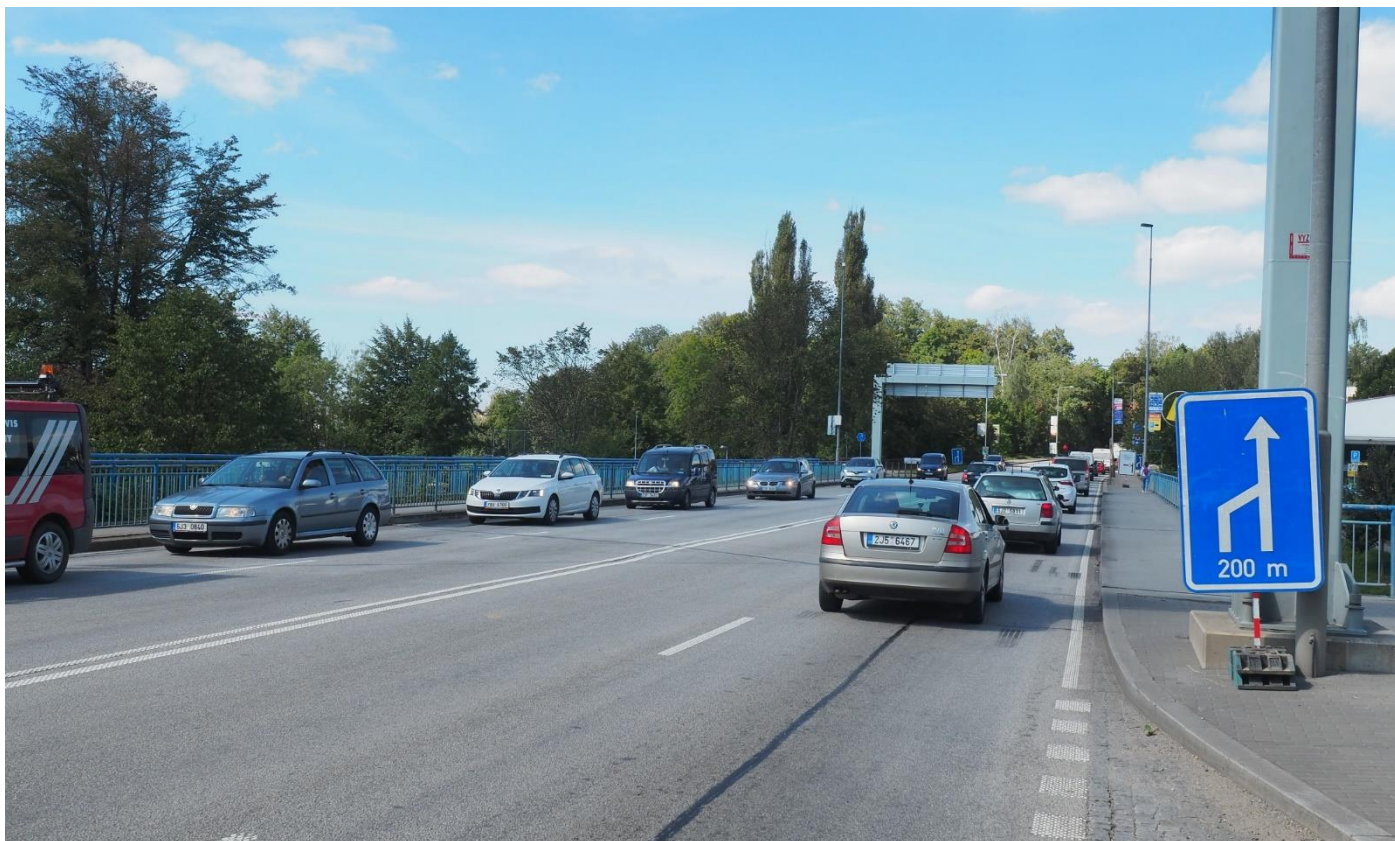
Obchvat Havlíčkova Brodu