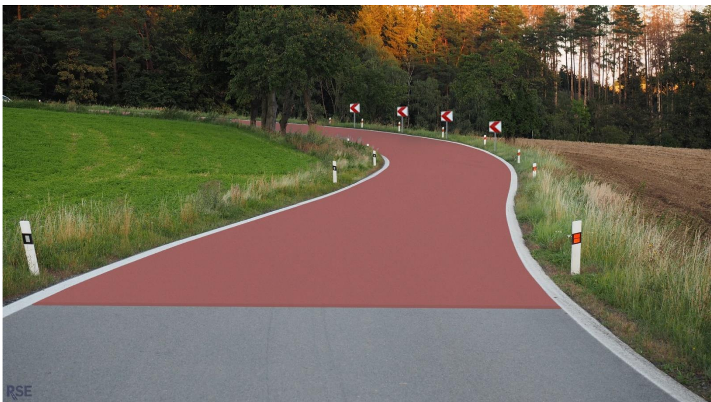
Úsek silnice II/385 u obce Střítež – navržené opatření na Dopravní konferenci

I TUTO PREZENTACI SI MŮŽETE STÁHNOUT A PROHLÉDNOUT V SEKCI „KE STAŽENÍ“.