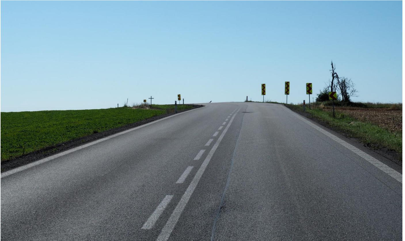
Oblouk na silnici I/38 u Svojkovic