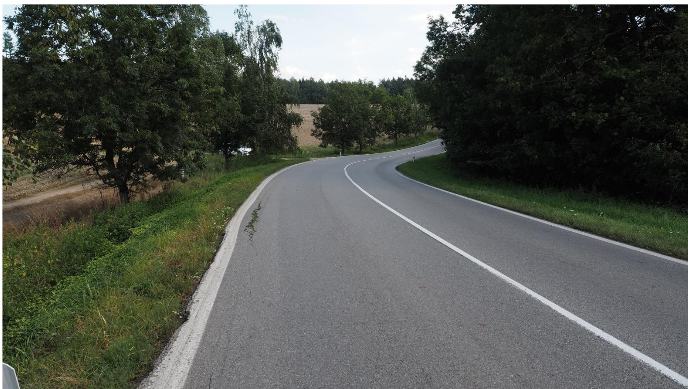
Úsek silnice I/34 u Humpolce – aktuální stav

Jiří Tesař ,Česká společnost pro osvětlování- Když se na to podívám v noci, tak viditelnost je velice tryskní, jelikož se zde nachází mírný horizont. Vodící sloupky jsou po 50 m a určitě by si to zasloužilo tyto sloupky zahustit podle normy tak, aby to bylo v závislosti na poloměru oblouku. Na středovou čáru bych doporučil umístit tzv. „kočičí oči“ protože odrazné vlastnosti v noci budou velice špatné.