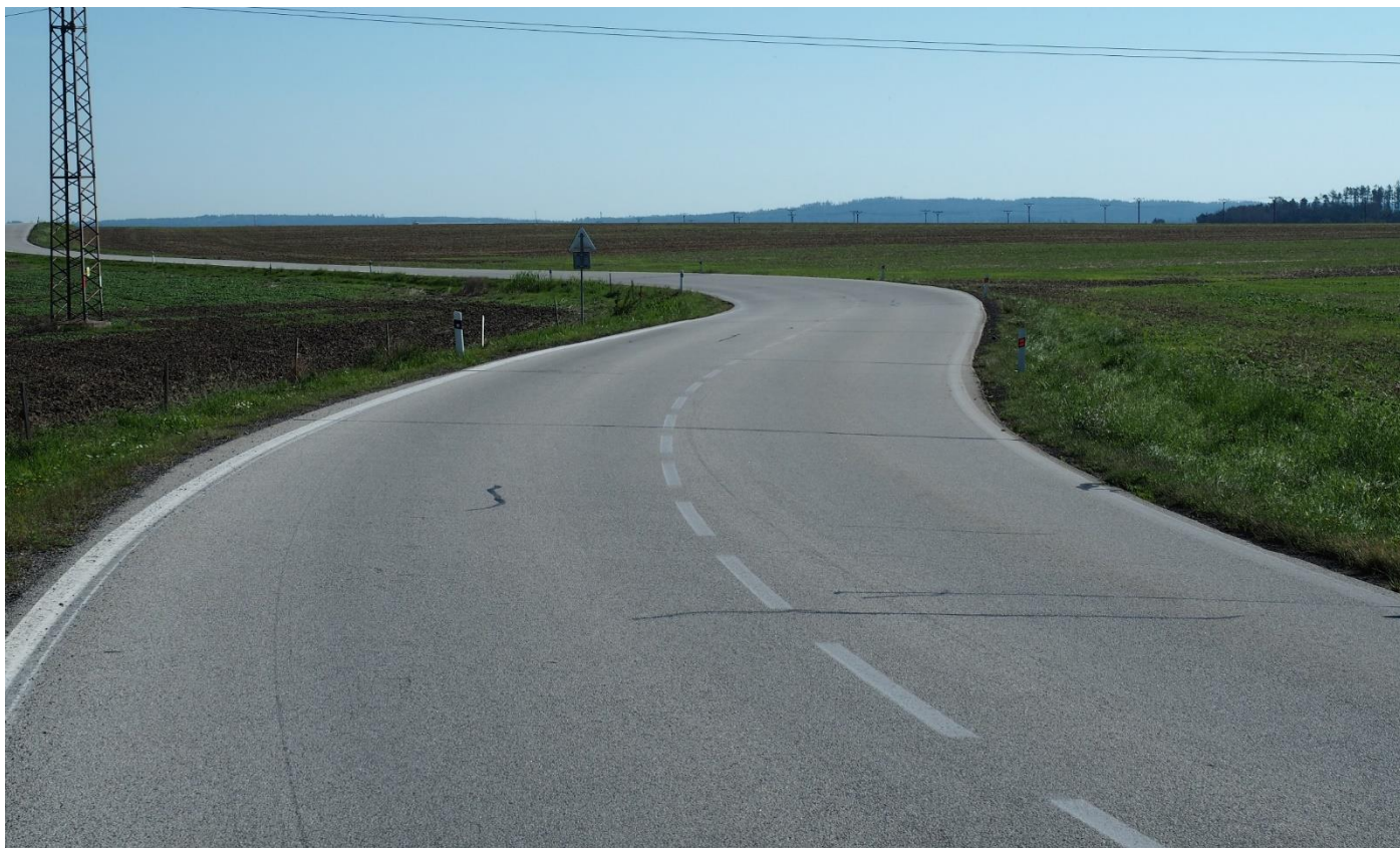
Úsek silnice II/152 u Mor. Budějovic