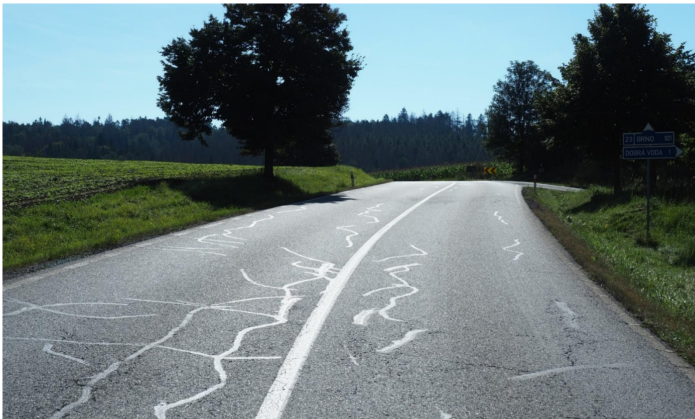
Oblouk v křižovatce na I/23 u Mrákotína